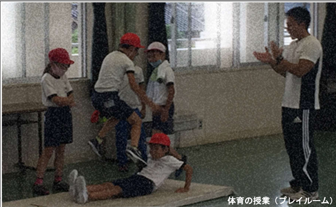
体育の授業（プレイルーム）