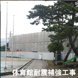
体育館耐震補強工事

体育館の耐震化工事が始まりました。雨の日には、プレイルームで体育を行い、休み時間はオセロゲームやカードゲームなどをして、楽しく過ごしています。