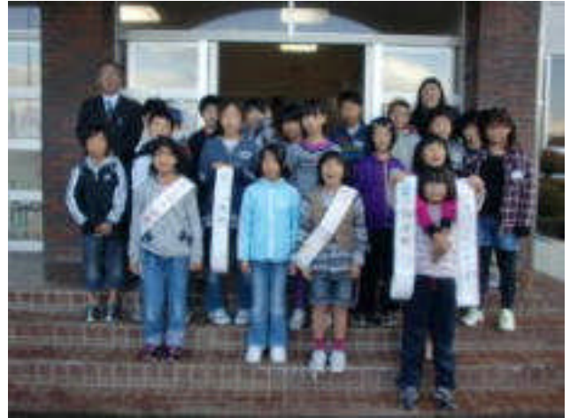
5年生と職員による愛さつ運動

ところで、荒城及び八幡町の一部の子供たちの通学路の変更に伴い、11月1日より、朝、第四銀行さんの寮の近くで、街頭指導を行っているのですが、そこを通る佐和田中学校の生徒さんや高校生の皆さんのあいさつに大変感心しています。とても自然に「おはようございます」とあいさつが出てくるのです。男の子も女の子もです。さすが八幡のお兄さん、お姉さんです。さっそく子供たちに、「ぜひ、みんなもお兄さんお姉さんみたいになってね!」と話しました。あいさつができるって本当に素晴らしいことだと思います。