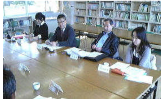
学校保健委員の皆様

2月8日に、学校医様、学校歯科医様、保健師様、栄養教諭様から来校いただきました。就寝時刻はある程度の成果は出ているが、引き続き取組が必要であることや、歯の未処置率が高いことなどを確認しました。そして、肥満や、虫歯、就寝時刻は、どれも関係するということが話し合わせ、来年度は、切り口として歯の健康から迫ってはどうかという意見も出されました。