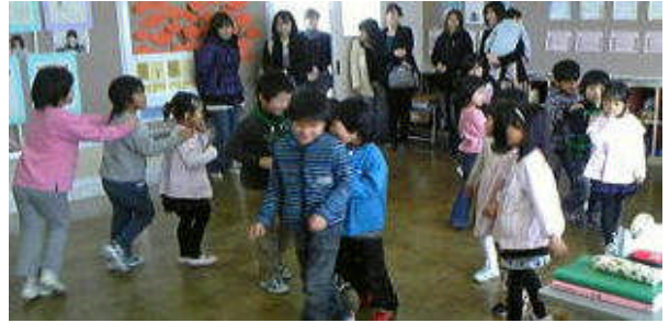
ジャンケン列車で楽しく活動