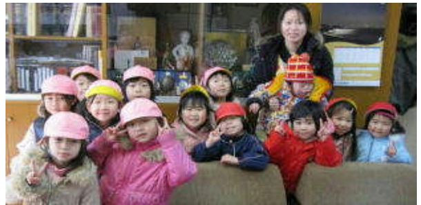
校長室で「はい ポーズ」