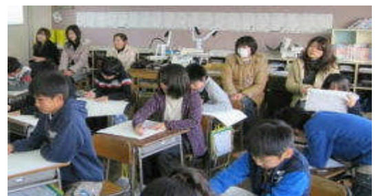
5年生の授業参観風景

2月15日には、多くのお家の方に来校いただき、ありがとうございました。特に午後からは、縄跳びの応援をたくさんしていただき、子供たちは、自分の記録やチームの記録を伸ばすことができました。