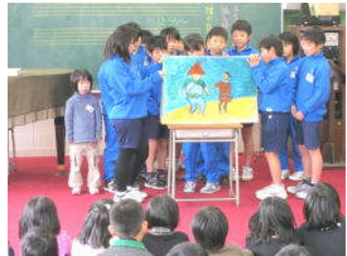
紙芝居「八幡の白からす」

3月16日に4年生が2学期から学習してきた八幡の歴史についての学習発表を昼休みに行いました。八幡に伝わる昔話「八幡の白からす」の紙芝居を披露したのです。自分たちの住む地域への思いをより一層強くできたのではないかと思います。