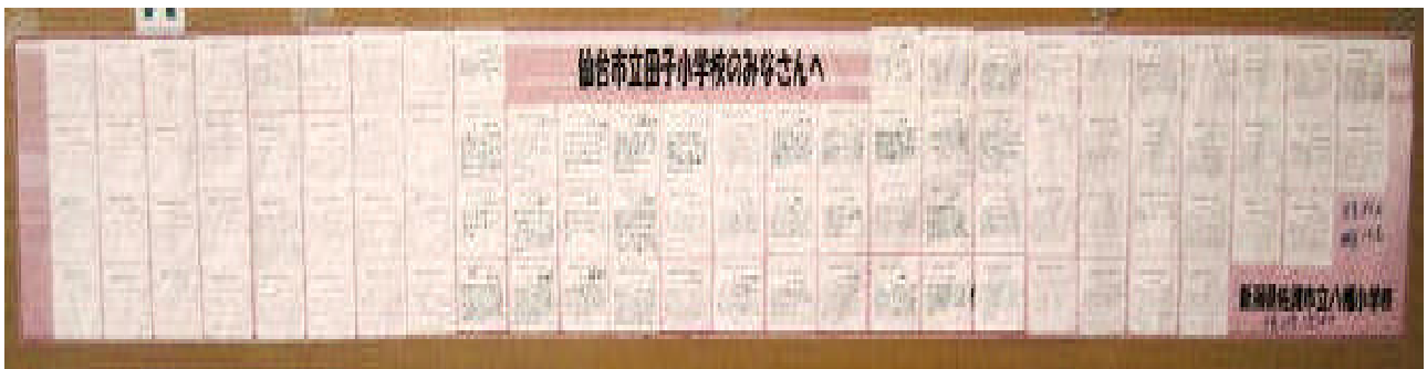
児童80名・職員14名のメッセージ