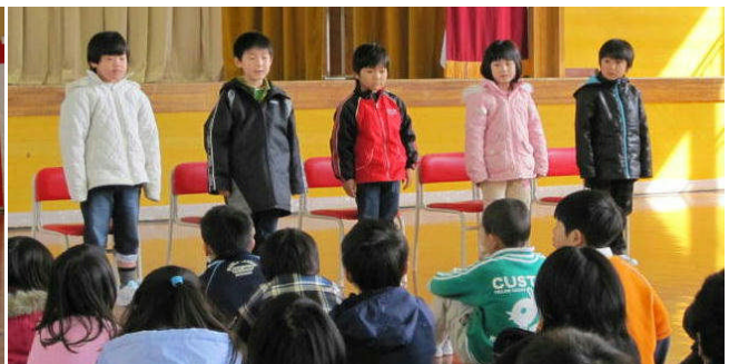
児童会主催「1年生を迎える会」