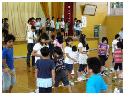
次は総務委員と最後は…