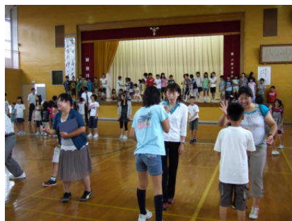
まずは先生方とジャンケン