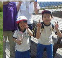
ドンデン山荘にて