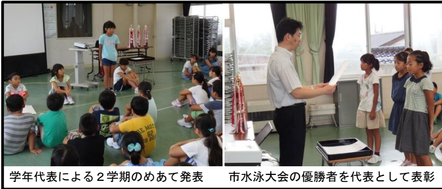
学年代表による2学期のめあて発表