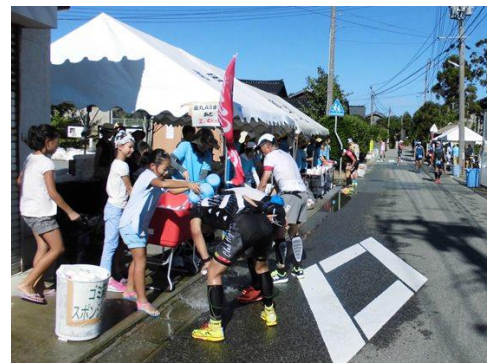
八幡ウォーターステーションで働く子ども

八幡ウォーターステーションは、ランコースに設置されたウォーターステーションです。スイム、バイクを終え、ランが始まって3.1kmの位置にあります。過酷な暑さにより「例年以上に疲労が激しい」と、選手の皆さんが話していらっしゃいました。そんな皆さんに冷えたスポンジや飲み物、氷を渡すのがボランティアの役割です。これ以外にも、八幡銀杏の会・八幡分館の皆さんが交通整理や選手誘導を行ったり、果物を振る舞ったりしていました。