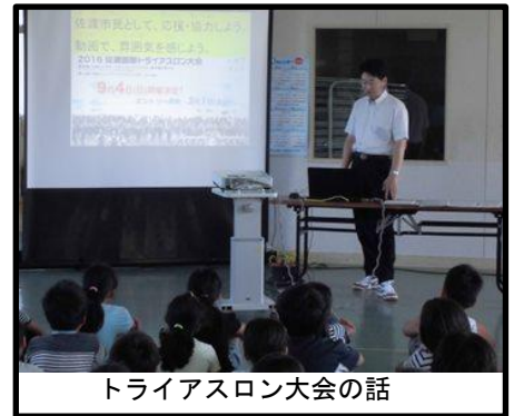
トライアスロン大会の話

8月26日(金)の始業式では、各学年の代表児童6名が2学期のめあてを発表しました。授業、家庭学習、合唱などについて、どんなことをがんばりたいかを具体的に話してくれました。そのめあてを聞いて、自分もがんばりたいと考えた子どもたちも多くいたようです。校長講話では、2学期の大きな行事を紹介し、めあてをもって努力する大切さを話しました。