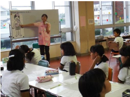
夏休みの生活を振り返らせる養護教諭

起きておおよそ15時間経過すると、体内時計がメラトニンという「睡眠ホルモン」の分泌を促し、人は眠くなります。このメラトニンは、眠りを誘うほかに、抗酸化作用によって細胞の新陳代謝を促し、疲れを取ってくれます。病気の予防や老化防止等に効果があると考えられており、注目されているホルモンのひとつです。ですから、しっかり睡眠をとることで、疲れがとれたり、骨や筋肉が成長したり、頭がすっきりしたりできるのです。健康な体づくりのために、良質な睡眠習慣を身に付けさせましょう。