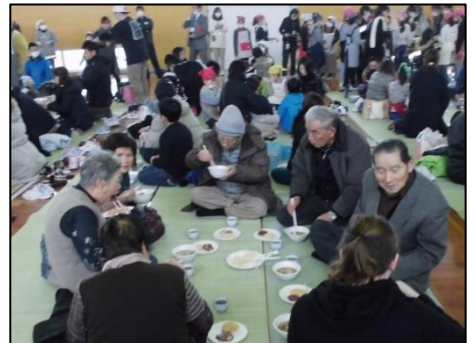
地区ごとに集まって座り、児童がお餅と八幡芋の芋煮を席までお届けしました。