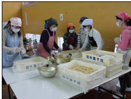
PTA役員と保護者ボランティアがきな粉餅とあんこ餅をつくりました。