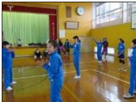
6年生チームは、PTA役員チームに惜敗。5年生チームには勝利。