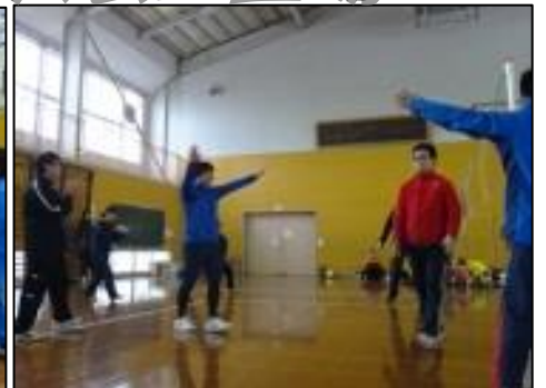
教職員チームは、やっただろうずと青年会と対戦し、若者が活躍するも2敗。