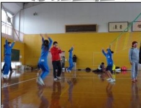
今年は5年生チームも参加。育成会チームと対戦し、1セット目を先取。