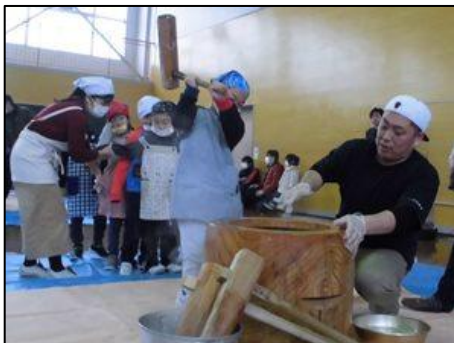
保育園3歳児から、もちつきをしているため、1年生も杵に慣れていきます。

さらに今年度は、民生委員・児童委員の皆様にご協力いただき、75歳以上の一人暮らしのお年寄りに対して、案内状や年賀状をお届けしました。お礼のお手紙やお電話をいただきました。もちつき大会を運営して下さったPTA役員、保護者ボランティアの皆様、芋煮を振る舞って下さった八幡・银杏の会の皆様、漬物をお届けくださった皆様、心より御礼申し上げます。