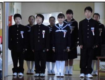
退場後に揃って一礼