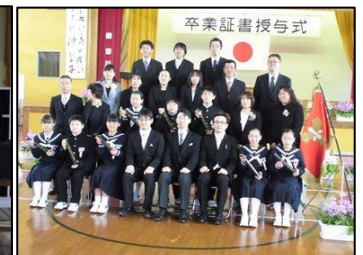
保護者と記念撮影