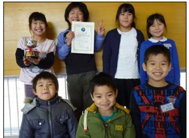
いつも元気なあいさつをしている中央・田望・野町1班