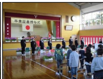
呼びかけ・お別れの歌