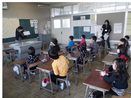
〈体験入学で授業を受ける新1年生〉

この記念すべき年に入学した児童は、11名です。6年生1名が転入しましたので、全校児童数61名となり、昨年度より3名増えました。PTA会員数は、2家庭増え、42家庭となりました。創立140周年の年が、子どもたちの思い出に残る1年間になるように、教職員一同、力を合わせてがんばってまいります。