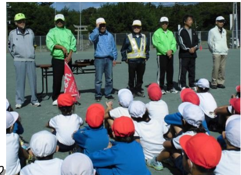
ボランティア7名が交通整理と見守り