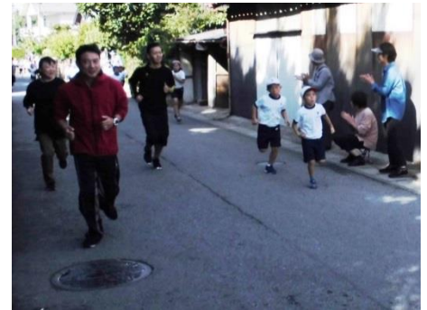
校地外に出たからは保護者も見守って走る

そのため、今年度は試行として、保護者が子どもたちの近くを走って応援する方法を実施してみました。保護者の皆様に対しましては、突然のお願いでしたけれど、10名ほどの皆様が子どもたちを励ましながらか一緒に走ってくださいました。強風のため、自己記録の出にくい条件でしたが、伴走してくださった皆様と応援して下さった皆様の声援のお陰で、子どもたちも全力を発揮することができました。ありがとうございました。