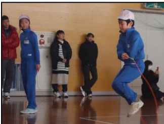
短縄によるリレー競技