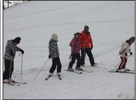
緩やかな斜面で滑走姿勢の練習