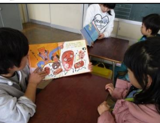
5年生が読み聞かせ