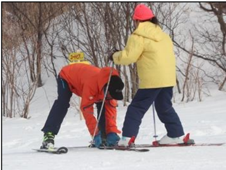
ブルーク姿勢で減速する練習