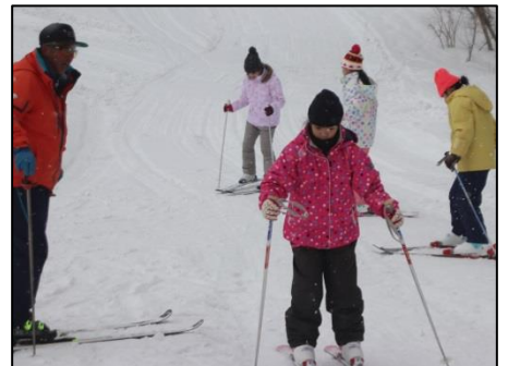
3名のインストラクターによる少人数指導