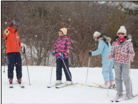
斜度のないところで歩く練習