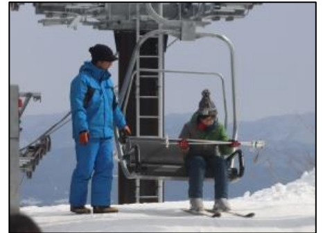
念願のチェアリフトが完成

スキー授業に際しては、佐渡スキー協会のご厚意で、スキー板、ブーツ、ストックのレンタル代は無料になっています。また、希望者には、スキーウェアを500円でレンタルしていただきました。さらに、「新潟っ子スキー体験拡大パイロット事業」(3年間)に応募しましたので、インストラクター3名分の費用は補助金を