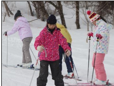
ストックで加速し、ブルークで止まる練習