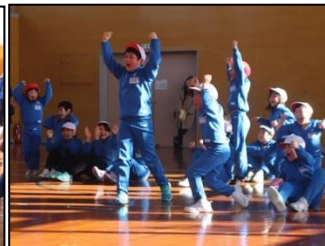
優勝班の歓喜の様子