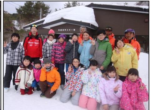
インストラクターとロッジ前で記念撮影