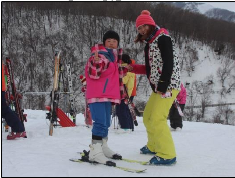
ロッジ前で準備運動してスキーを装着

2名を除いて、スキーを初めて経験しましたが、一気にうまくなりました。ご家族でスキー場に行き、さらに上達してほしいと思います。