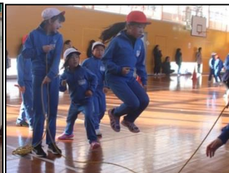
縦割り班での8の字連続跳び