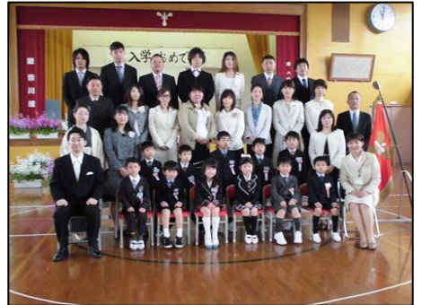
保護者と記念写真を撮影しました