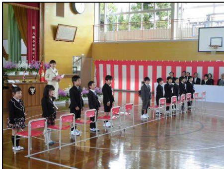
担任が呼名し、大きな声で返事しました

17名のお客様がお祝いにお越しくださいました。1年生の元気いっぱい返事の声が響き渡りました。