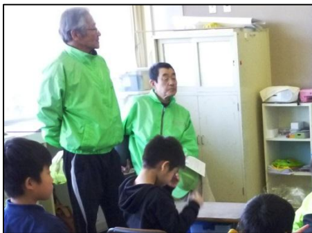
民生委員さん等にもご参加いただきました