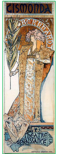
ミュシャのポスター

アルフォンス・ミュシャは、チェコスロバキアに生まれ、フランスでポスター画家として大成功をおさめます。右の劇場用ポスターは、ミュシャの出世作です。アール・ヌーヴォーの旗手として、フランスで不動の地位を築いたミュシャは、40歳の頃、「残りの人生をひたすら我が民族に捧げる」という誓いを立てます。50歳を迎えた年、故郷チェコスロバキアに戻り、16年間をかけて、全20作品からなる連作『スラヴ叙事詩』を制作しました。『スラヴ叙事詩』には、チェコ、スラヴ民族の伝承、神話、歴史が描かれています。サイズは小さいものでもおよそ4m×5m、大きいものでは6m×8mの壁画サイズです。ミュシャは、英雄よりも、むしろ民衆を描くことに情熱を注いだようです。農民、市民の写真やスケッチをもとにして、一人一人を精密に描きました。チェコ人の民族意識の高まりを目指した20作品であると言えます。