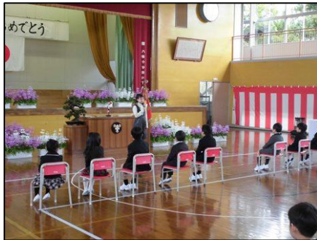
6年代表児童が堂々と歓迎の言葉を述べました