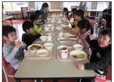
1年生の初めての給食はカレーでした