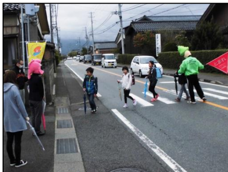
市教委持参のキャラクター帽子をかぶって