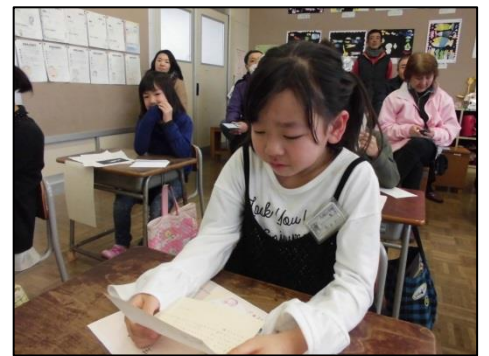
家族からの手紙に感動した子どもたち