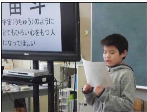
自分の名前に込められた願いを発表