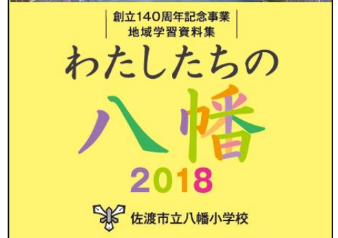
完成した「わたしたちの八幡」の表紙