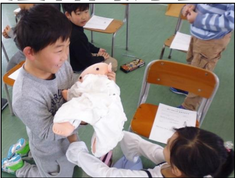
人形を抱き、模擬妊婦エプロンで重さを体験