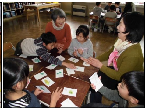
自分たちが作った野菜かたで遊ぶ