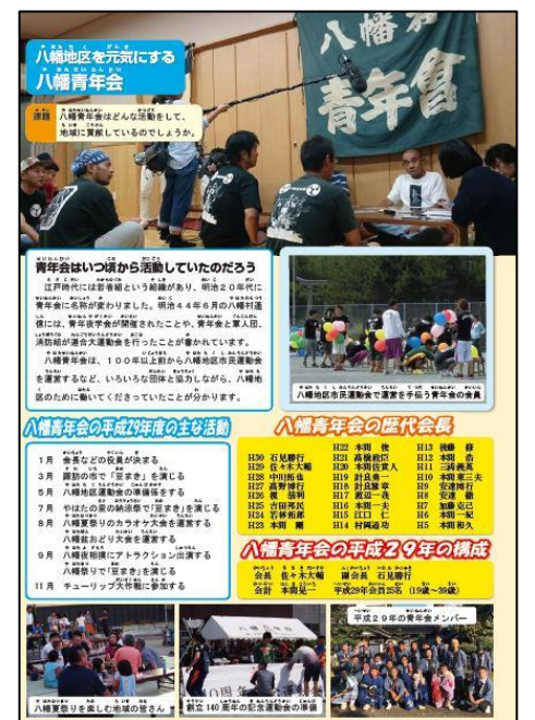
P22「八幡青年会」の貢献を考えるページ