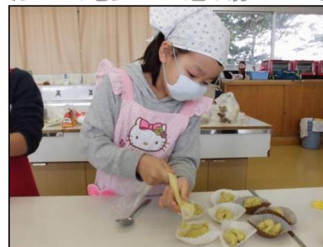
スイートポテトとカップケーキでおもてなし