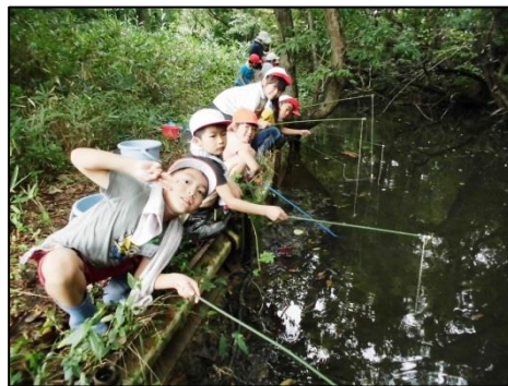
つつじヶ丘公園まで出かけました