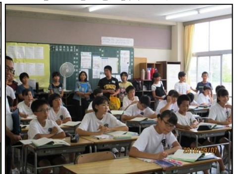
授業を参観し、小中交流会を行いました