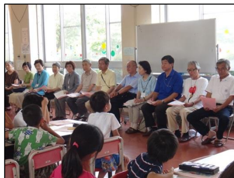
見守りの皆様を保護者、児童に紹介

8月の学校運営協議会の際、教室で「さようなら」をした後に子どもたちが遊具等で遊び、下校時刻が守られていないことが話題になりました。「ながら守り隊」に加えて、佐渡西警察署に対しても下校時刻をお知らせしており、下校時刻にパトロールを強化していただいております。見守りやパトロールをしていただくためには下校時刻を守ることが大切です。「八幡っ子のやくそく」を再配付しました。同じ下校時刻、同じ方向の人が、互いが見える距離で歩くことができるようにお声かけをお願いいたします。