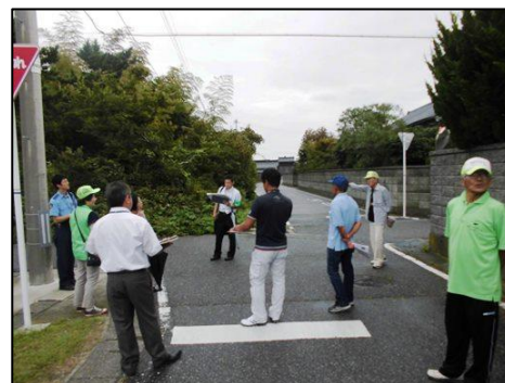
西警察署も参加した通学路合同点検