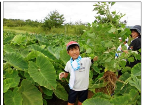
身長ほどまで八幡芋が成長しました