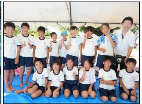
厳しい練習に耐え、タイムを縮めた5年生