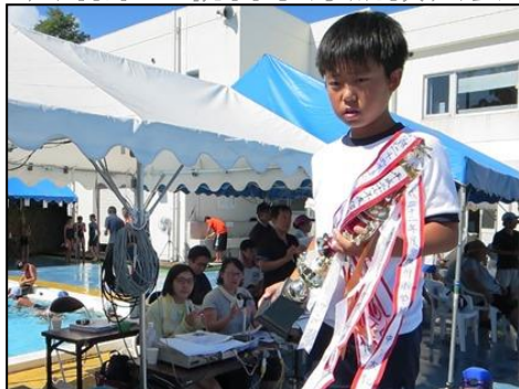
本部でトロフィーをもらいました