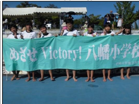
八幡の代表として全力で泳ぎ切った6年生