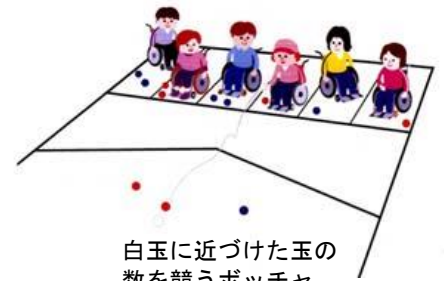
白玉に近づけた玉の数を競うボッチャ