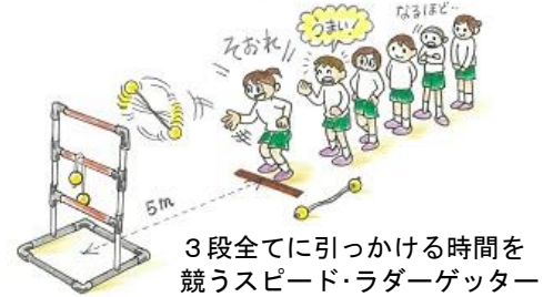
3段全てに引っかける時間を競うスピード・ラダーゲッター