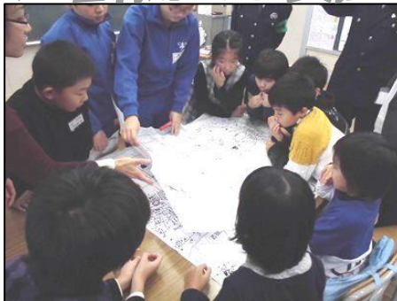
地域安全マップを見ながら危険箇所確認