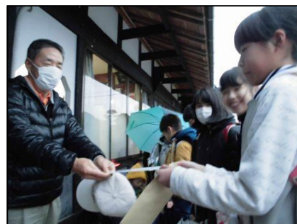
「こども110番の家」プレートを持参

今回の地域子ども会には、ながら守り隊の皆様に加えて、佐渡西警察署生活安全課と佐和田幹部交番から5名の警察署員の皆様が参加してくださいました。「こども110番の家」の意味についてもご指導してくださいました。地域子ども会後の集団下校の際に、「こども110番の家」プレートを持参し、日ごろの見守りへの感謝の気持ちを伝えました。実際に訪問することで逃げ込みやすくなり、子どもの危機回避能力が高まるのではないかと考えています。