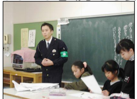
佐渡西警察署員からの防犯、安全指導