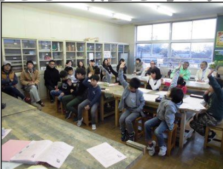
保護者も参加した地域子ども会