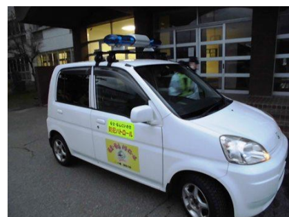
青色回転灯装備車両

パトロールの実施者は、警察本部長から交付されたパトロール実施者証を携行しなければなりません。パトロール実施団体として認められることも容易ではないそうです。