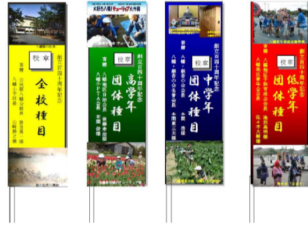
授与する「勝利の旗」

学校は、記念事業に協力していただく各地域団体長から寄付金を募って「勝利の旗」を作成し、地域団体長がそれを子どもに授与するなど、地域団体長が子どもと関わる場面を増やしていった。