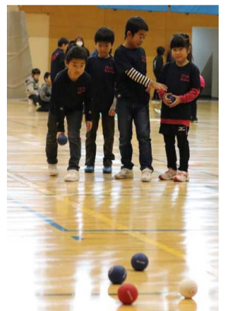
ボッチャの対戦中

佐和田地区公民館の事業として、毎年、様々なイベントを合わせて実施されていたが、子どもの参加者数が伸び悩んでいた。学校運営協議会において、分館から「小学生の参加を増やしたい」という要望が出された。ハッピーディさわたのイベントの1つに、ボッチャなどのパラリンピック種目を取り入れたジュニアニュースポーツフェスティバルが行われるという情報を得たので、全校朝会でパラリンピック教育教材を使用し、ボッチャ等を紹介した。文化祭の午後には校内ニュースポーツ大会を実施し、全校児童がボッチャ等を楽しんだ。さらに、八幡スポーツクラブとして、ハッピーディさわたに参加することにし、希望者を募り、昼休みの時間を使ってニュースポーツ教室を開催した。