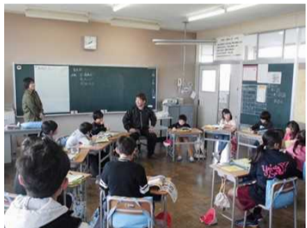
育成会長とのグループ協議

学校運営協議会の場で、団体長が意見交換し、協力体制を築くことで、新事業が実施されたり、既存の事業への参加者が増えたりするなどの成果が表れた。さらに、学校運営協議会の場を超えて、子ども自身が各事業に対して、感想や意見を述べる場を設けることで、PDCAサイクルが一層機能し、子どものための充実した事業が継続されると考えた。例年11月に実施している「※八幡キャリア教育フォーラム」を、その場として活用した。