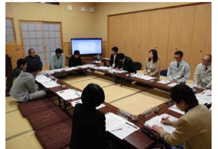
学校運営協議会の様子

校運営協議会の委員として委嘱し、現在12名（平成30年度）が参加する組織となっている。