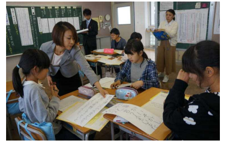
6年が意見文を発信

グループ協議後に完成させた意見文には、自分のできることをして、「PTAもちつき大会のポスターを地区に貼る」「自分も進んで参加する」「大人の手伝いをする」など、各事業に主体的に関わり、地域団体に貢献しようとする記述が見られた。