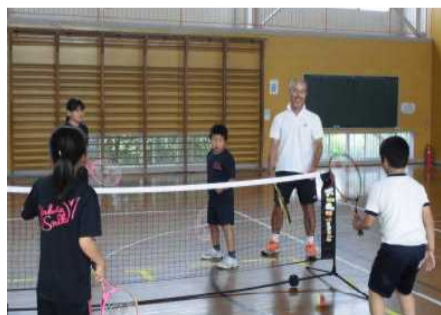
放課後テニス教室

ボール投げやソフトバレーボールは、银杏の会から紹介していただいた地区チームの方から指導していただいた。他にもテニス教室はテニス協会、ニュースポーツ教室ではスポーツ推進員の方、おおなわ教室では保護者の協力を得るなど、日頃からスポーツに親しむ多くの大人とかかわること