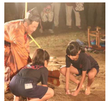
八幡宮奉納夜相撲

八幡宮の前夜祭として行われる奉納相撲大会である。育成会が運営を行っている。年々参加者数が少なくなるにともなって、保護者や地域の方々が応援に訪れる数も少なくなってきた。学校では、学習指導要領でも取り上げられ