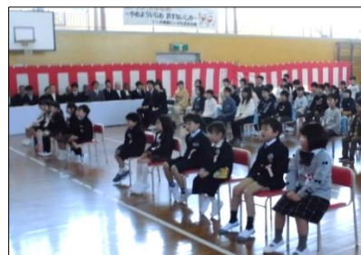
お祝いのお話をしっかりと聞くことができました。