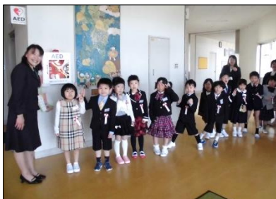
入学式が始まる前、ちょっぴり緊張しました。