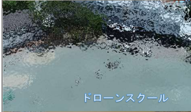
ドローンスクール