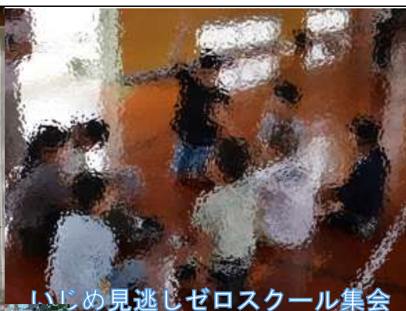
いじめ見逃しゼロスクール集会