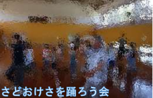
さどおけさを踊ろう会