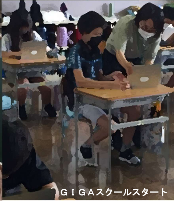
GIGAスクールスタート