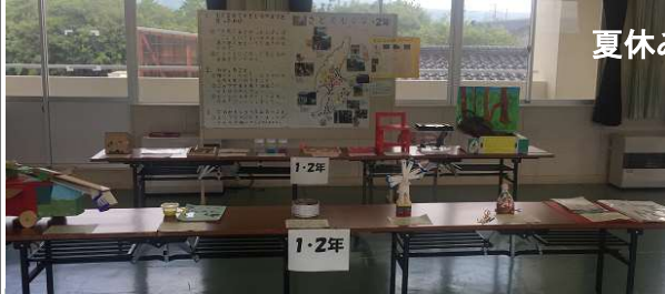
夏休み作品発表会